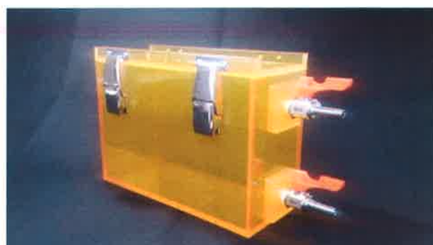
バレックス製タイトボックス 耐有機溶媒性