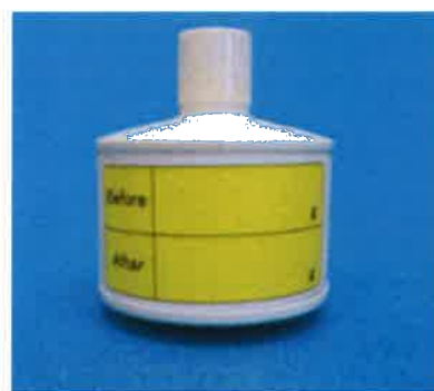
活性炭キャニスター